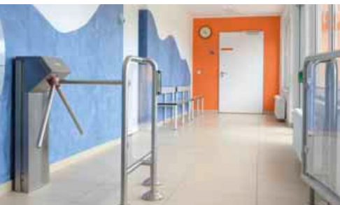
Bei der Modernisierung im Jahr 2012 wurde im Eingangsbereich der Schwimmhalle vom Typ Anklam ein moderner Kassensystem installiert.