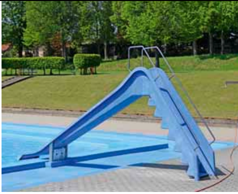
Neben einer 16 Meter langen Breitrutsche sorgt eine 3-Meter-Kinderrutsche für noch mehr Spaß.