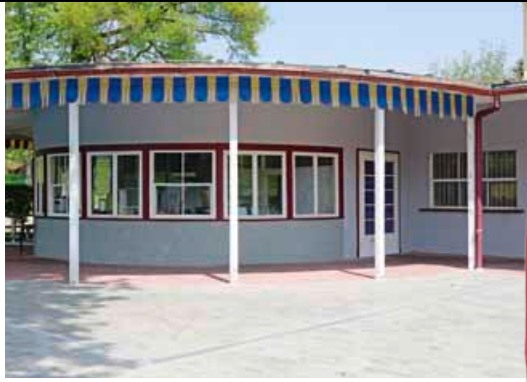
Auch in diesem Jahr können sich die Gäste bei einem Imbiss am Gastronomie-Rondell stärken.