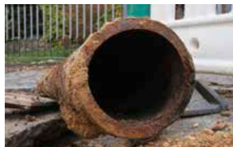
In die Jahre gekommenes Trinkwasserrohr.

serentsorgung erfolgt über Interimsleitungen. • In der Rembrandtstraße werden die Trinkwasserleitungen einschließlich der Hausanschlüsse ausgewechselt. Die Arbeiten enden witterungsbedingt am 21. Dezember und werden im Frühjahr fortgesetzt. Die Straße ist in dieser Zeit für Anwohner befahrbar.