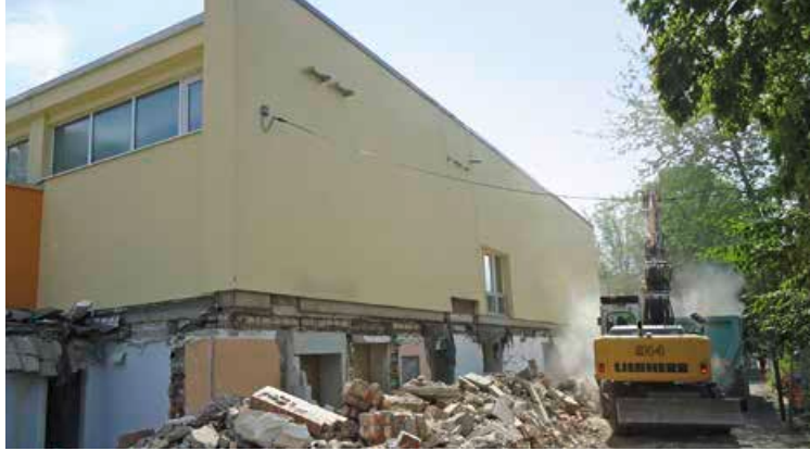
Abbrucharbeiten am Altenburger Hallenbad.